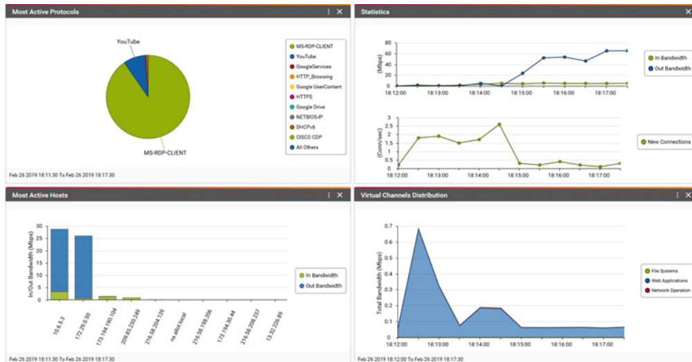
ACG-500 のダッシュボード

組織の意思決定者は、Allot の高度なレポートングおよび分析ダッシュボードで、ネットワークやアプリケーションの使用状況を手に取るように把握できます。リアルタイム監視、使用状況の指標、QoE、オンライン行動ダッシュボードでアプリケーションやユーザー、エンドポイントトラフィックを可視化し、ネットワークパフォーマンスへの影響を分析して、迅速に問題に対応できます。ダッシュボードの各レポートは連動しており、インタラクティブな操作が可能です。あるレポートでドリルダウンやデータ項目の変更を行えば、ダッシュボードの他のレポートも即座に更新されます。ダッシュボードのビューは簡単にカスタマイズできるので、いつでも必要な情報を入力できます。